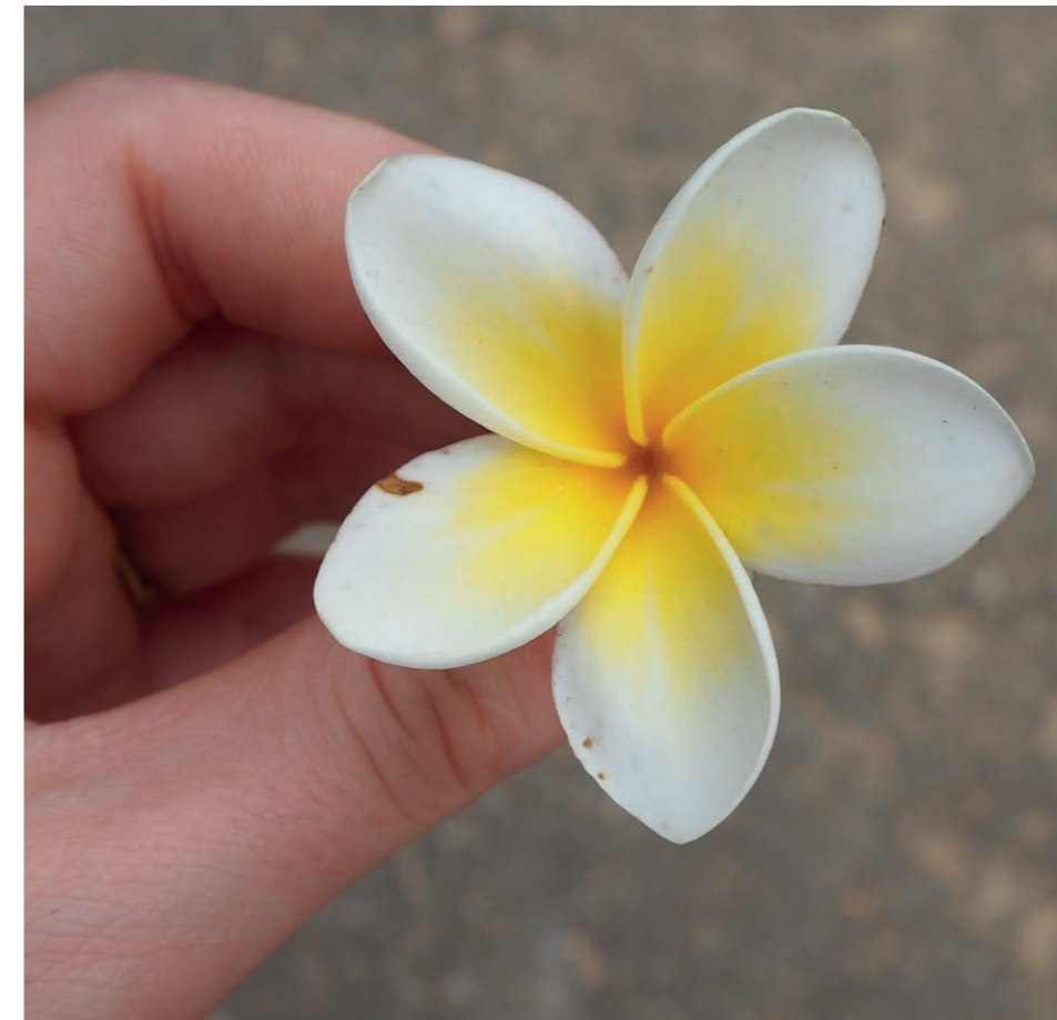
Beate Kaufmann und Gerhard Krautwurst

können als mit 20 oder 30 Jahren. Wir stehen mit beiden Beinen voll im Leben, haben eine gute Arbeit, haben ein Haus und können uns ganz auf unser Wunder konzentrieren. Und sind einfach nur dankbar dafür.